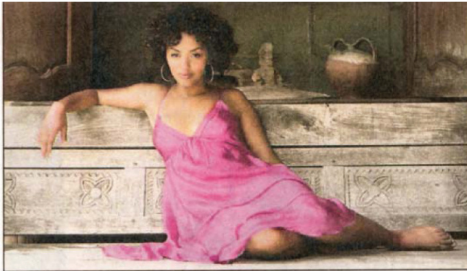
tlz_11.08. Soha aus Frankreich tritt am Donnerstag, 13. August, 20 Uhr in der Kulturarena auf.