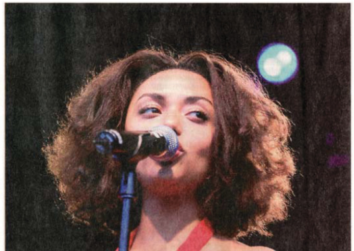
Der Spaß am Auftritt ist ihr ins Gesicht geschrieben: Soha animierte die Besucher der Kulturarena am Mittwoch zum Singen und Salsa-Tanzen.

Sohas Bühnenelan geht so weit, dass sie eine volle halbe Stunde Zugabe gibt. Und selbst dann hat sie noch Atem für ein langes, kraftvolles „Jennaa!“